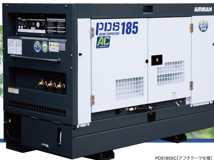
PDS185SC [アフタクーラ仕様]